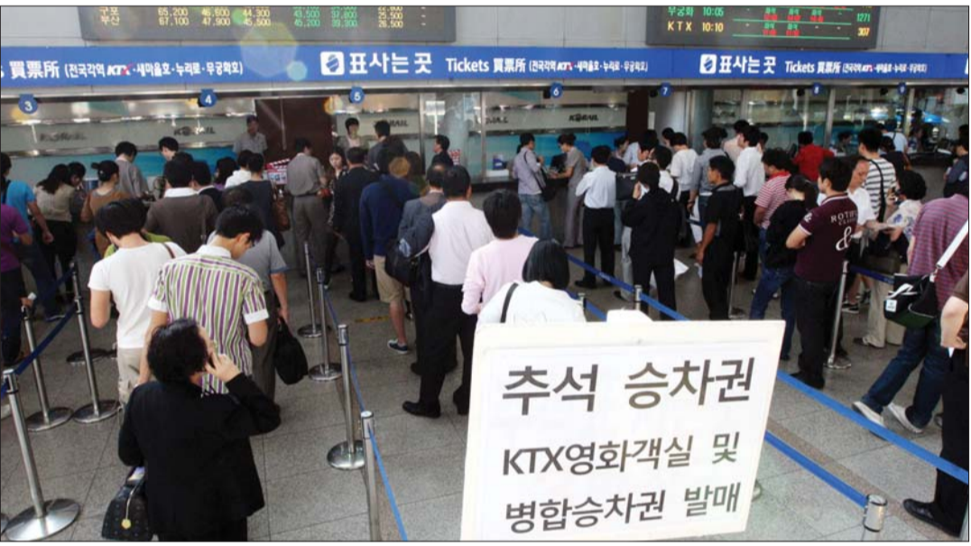
‘고향가는 병합승차권 잡아라’ 추석 연휴기간(10월1~5일) 병합승차권 예매가 시작된 17일 오전 서울역에서 시민들이 예매를 위해 줄을 서 있다. 병합승차권은 KTX나 새마을호 열차 이용구간 중 좌석이 있는 구간은 좌석을, 나머지 구간은 입석을 이용하는 티켓이다. 서울/연합뉴스

여기에 다양한 이벤트와 공동쿠폰 등도 재래시장의 매력을 더하고 있다. 서울 광진구 '중곡제일골목시장'은 2005년 전국 최초로 공동쿠폰제를 시작해 소비자에게 일정 구매 금액에 따라 100원권 쿠폰을 지급, 10장을 모으면 현금처럼 사용이 가능하다. 서울 도봉구 방학동 '도깨비시장'은 주 3회 '반짝세일'을 실시하고 있다. 한정된 품목과 수량을 지정해 10~50% 대폭 할인된 금액에 판매해 소비자들의 만족도를 높인다. 강서구의